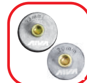
لقمه ۲۰ و ۲۵ میلیمتری